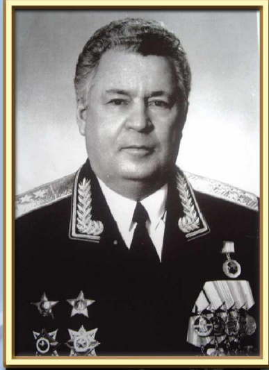
Генерал-полковник Пьянков Б.Е. Начальник гражданской обороны СССР с октября по декабрь 1991 г.