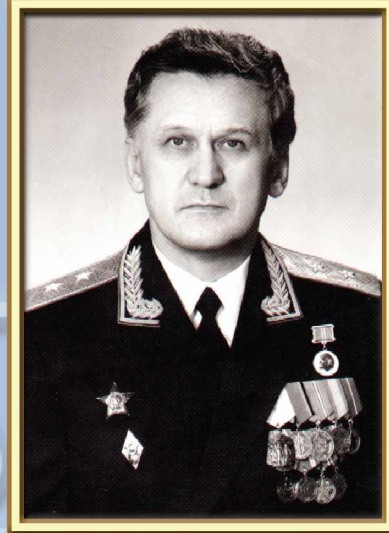
Генерал-лейтенант Долгин Н.Н. Начальник гражданской обороны СССР с января по 30 мая 1992 г.

На содержание и направление этапа развития гражданской обороны решающее влияние оказали внутренние обстоятельства. В первую очередь, такие события, как авария на Чернобыльской АЭС (1986 г.) и Спитакское землетрясение в Армении (1988 г.).