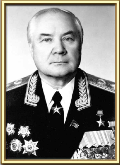
Генерал армии Говоров В.Л. Начальник гражданской обороны — Заместитель Министра обороны СССР с 1986 г. по сентябрь 1991 г.