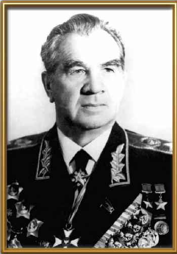
Маршал Советского Союза Чуйков В.И. Начальник гражданской обороны СССР с 1961 г. по 1972 г.

Рост разрушительной силы ракетно-ядерного оружия и неограниченные по дальности возможности его доставки к целям вызвали необходимость создания системы, которая бы обеспечивала надёжную защиту населения и народного хозяйства от оружия массового поражения в масштабе всей страны.