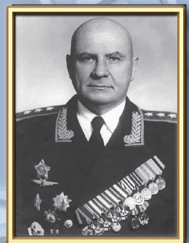
Генерал-полковник авиации Толстикова О.В. Первый заместитель Министра внутренних дел СССР по МПВО с 1956 г. по 1961 г.